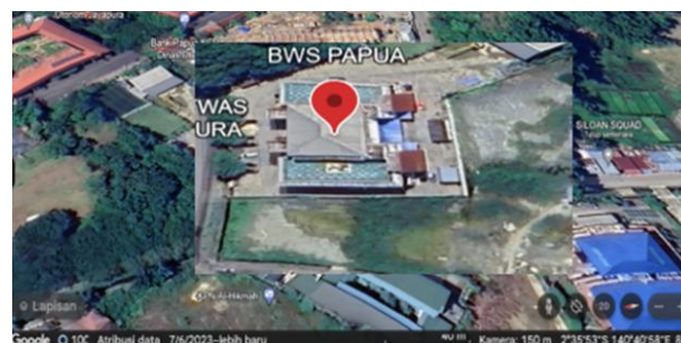
Gambar 2. Peta Lokasi Penelitian

Lokasi penelitian ini terletak di Kantor BWS Papua yang beralamat di Jl Raya Abepura, Wahno, Kompleks Otonom Kota Jayapura. Menurut data pada Kantor BWS Papua (2023), luas tanah di Kantor BWS Papua tersebut adalah 7633 m 2 sedangkan luas bangunan 4550 m 2 . Luas lahan yang ingin direncanakan untuk penerapan Lubang Resapan Biopori adalah 224 m 2 . Adapun peta lokasi bangunan dapat dilihat pada Gambar 2